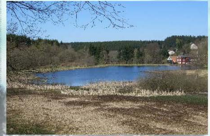
Eulenspiegler Teich Größe ca. 3,5 Ha

Besatz: Regenbogenforellen, Hechite, Karpfen, Barsche, Brassen