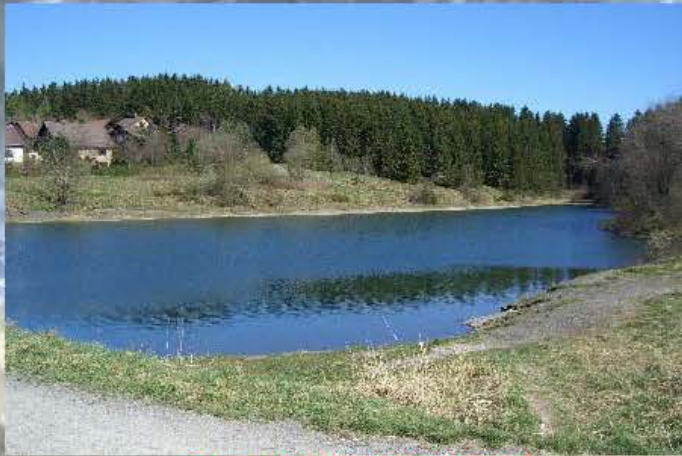
Oberer Eschenbacher Teich Größe ca. 1,2 Ha

Besatz: Hechite, Karpfen, Schleien, Rotfischern