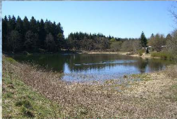
Oberer Zechenteich Größe ca. 0,9 Ha

Besatz: Regenbogenforellen, Karpfen, Barsche, Brassen