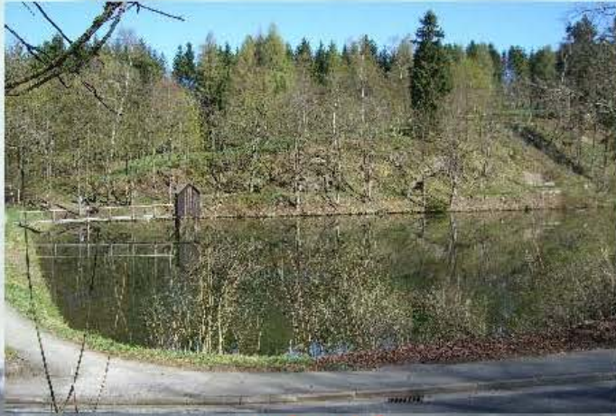
Carler Teich Größe ca. 0,9 Ha

Besatz: Hechite, Regenbogenforellen, Barsche, Schleien, Rotfischern usw.