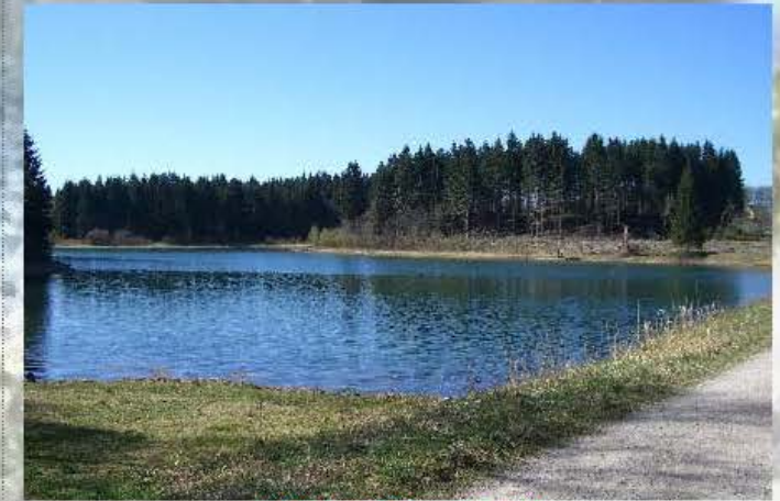
Oberer Pfauenteich Größe ca. 3,4 Ha

Besatz: Regenbogenforellen, Karpfen, Schleien