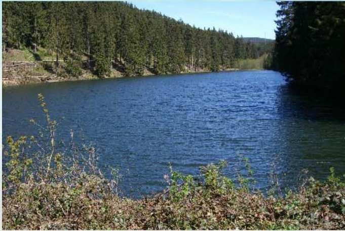
Unterer Spiegelthaler Teich Größe ca. 3,5 Ha Besatz: Bachforellen, Barsche