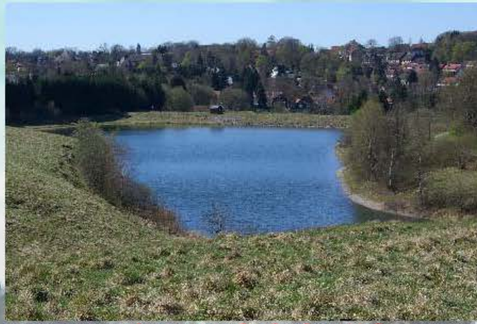
Unterer Eschenbacher Teich Größe ca. 3,0 Ha

Besatz: Hechite, Regenbogenforellen, Barsche, Schleien, Rotfischern usw.